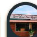
Galeri Warisan Pulau Tg. Surat