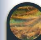
Udang, siput gonggong dan gamat