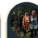
Mendaki Bukit Gedong Penggawa Timur