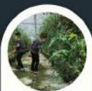
Pick Eat Fresh tomato cherries