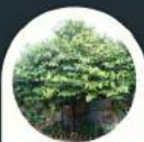
Rare Plant Tour