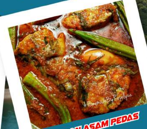
RESTORAN ASAM PEDAS Berlatar belakang panorama laut