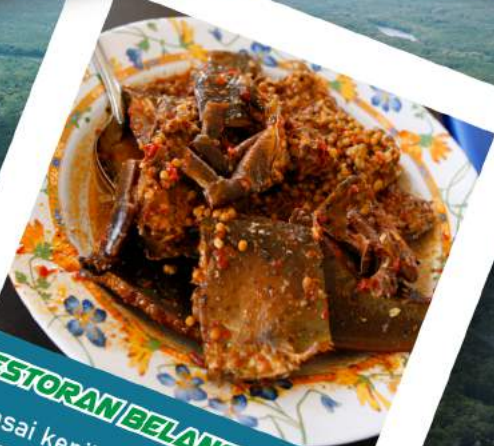
RESTORAN BELANGKAS Merasai kenikmatan makanan laut yang segar