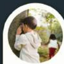
Explorace hide seek