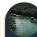
Menyelusuri paya bakau 30 minit