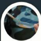
Merasai madu kelulut dari sarang