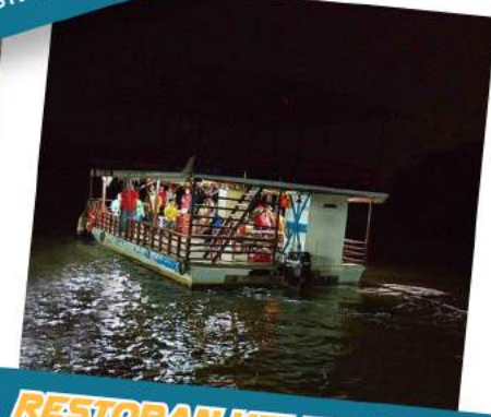
RESTORAN KELIP KELIP Menikmati pemandangan makan di waktu malam menaiki boat dan melihat kelip kelip