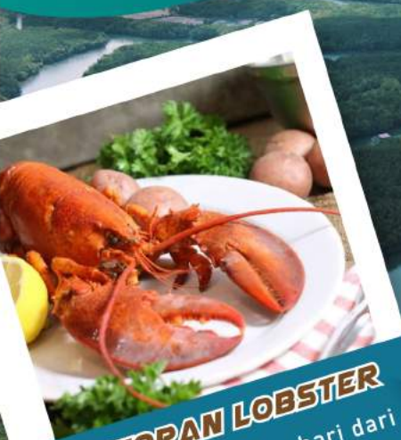
RESTORAN LOBSTER Lobster segar setiap hari dari hasil nelayan tempatan