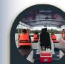
Melalui Jalan Air (menaiki bot)