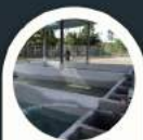
Lawatan ke ternakan kelah (Raja Sungai)